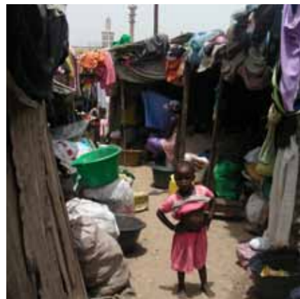
↓ BARACCOPOLI MEDINA ↑